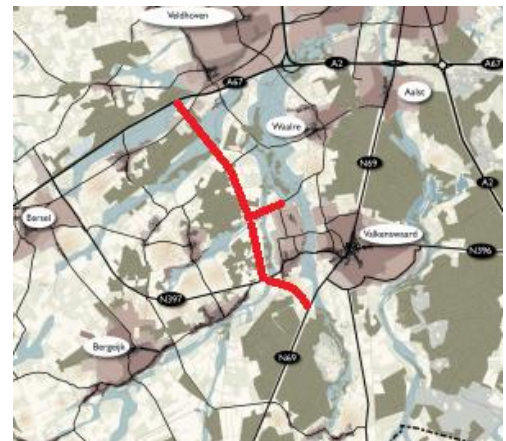
Kaart van de Grenscorridor met in rood de Westparallel, waar het Bestuurlijk overleg haar voorlopige voorkeur voor heeft uitgesproken.