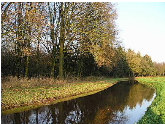
Grootgoor en het beekje de Run

Na onderzoek van een aantal alternatieven komt het Bestuurlijk Overleg van de 25 partijen eind 2010 na een verre van overtuigende weging in eerste instantie tot één voorkeursalternatief: de Westparallel en Nulplus. Het alternatief met zo weinig mogelijk pijn voor de meest betrokken gemeenten, maar wel met een nieuwe provinciale weg met mogelijk 2 x 2 rijbanen dwars door het nog “maagdelijke”, stille en kwetsbare beekdalenlandschap nabij de beeklopen van de Keersop en de Run.